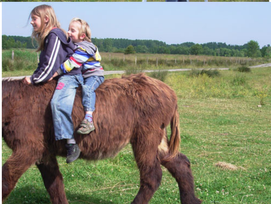
Fenouil et Casimir profitent pleinement des dizaines d'hectares à leur dispositions.